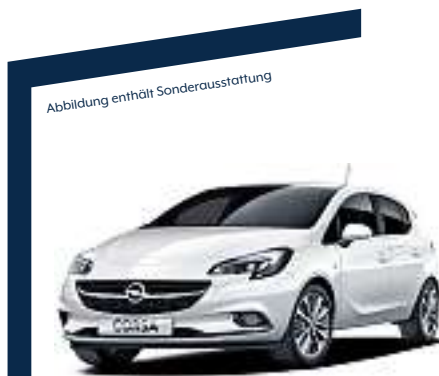
Abbildung enthält Sonderausstattung

Über 30 Fahrzeuge sofort verfügbar, zum Beispiel: