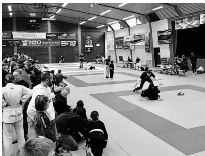
Über 300 Teilnehmende, darunter 160 Kinder und Jugendliche sowie 150 Erwachsene, nahmen am Wochenende, vom 25. bis 26. November, an der 21. Internationalen Deutschen Brazilian Jiu Jitsu Meisterschaft in Altenheim teil.