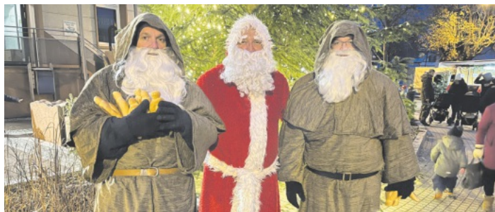
Der Nikolaus besuchte den Adventsmarkt mit gleich zwei Knechten Ruprecht.