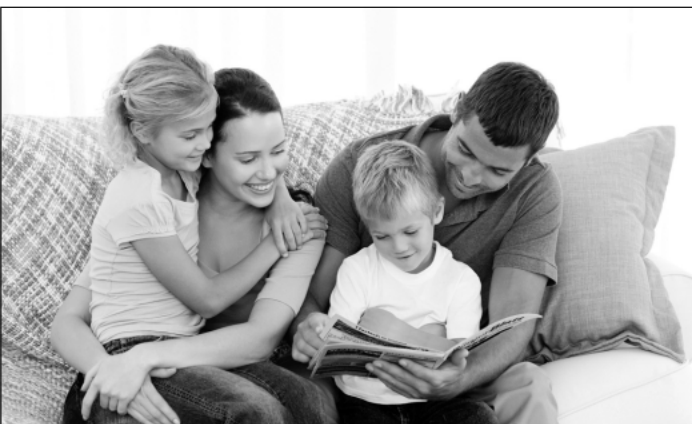
Lesespaß für die ganze Familie!

Fr. 14.30 Uhr - Herbert-Adam-Halle Altenheim